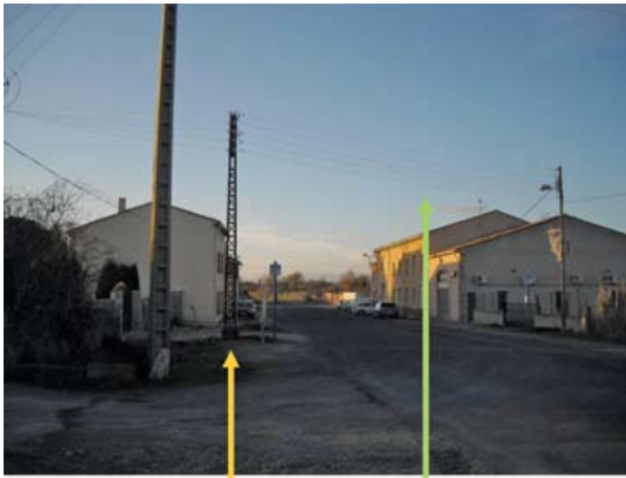
Enlèvement du support métallique et passage des câbles Basse Tension en souterrain et sur façade.

Le projet de reconstruction du réseau basse tension du hameau de Laparre fait suite aux nombreux dépannages régulièrement réalisés par les équipes d'ERDF. Le réseau actuel étant complètement vétuste, il va être remplacé avec la volonté d'améliorer aussi l'environnement visuel du hameau, très chargé en fils et supports :