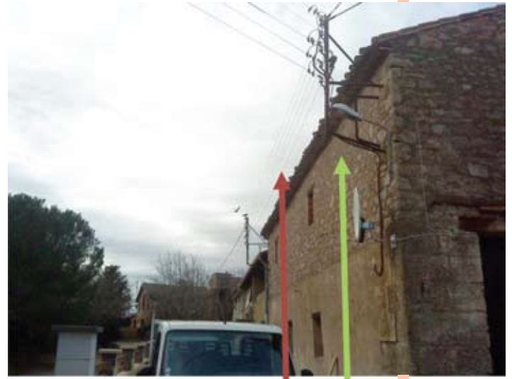
Enlèvement des « consoles » métalliques et des fils. Passage du câble réseau sur la façade des maisons.

Le début des travaux est prévu pour le Lundi 24 février 2014. Ils seront réalisés par l'entreprise SNE Madaule . L'étude préalable aux travaux a été réalisée par l'entreprise AUDEL .